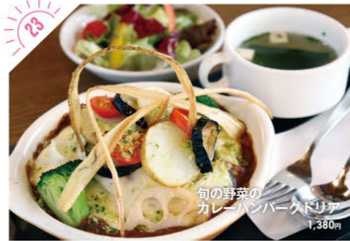
旬の野菜の カレーハンバーグドリア 1,380円

☎028-653-4649 宇都宮市南町11-9 ①PM5:00～深夜0:00(L.O./PM11:00) ②月曜(12/31は営業) ③12台