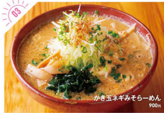
かき玉ネギみそらーめん 900円

☎028-610-1515 宇都宮市二荒町8-1 ①PM5:00~深夜1:00 ②第1-3日曜 ③近隣コインP利用