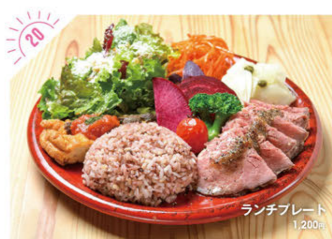
ランチプレート 1,200円

☎028-612-8434 宇都宮市御幸ヶ原町68-32 林ハイイツ 102 ①AM11:30～PM2:00(L.O.)、PM6:00～PM9:30(L.O.) ②月曜、年末年始はランチのみ営業 ③6台