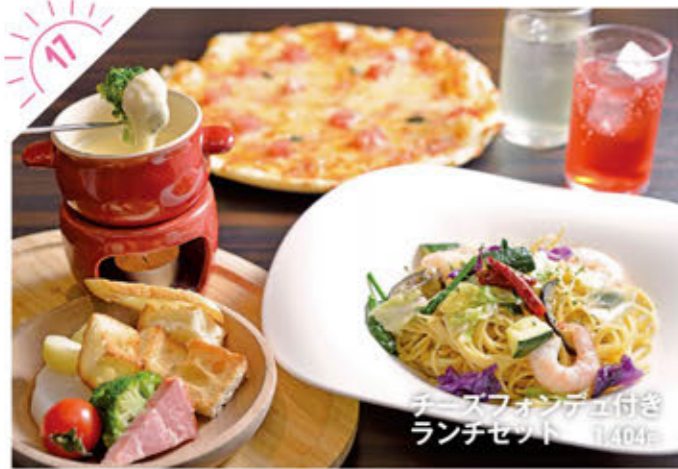
チーズフォンデュ付き ランチセット 1,404円