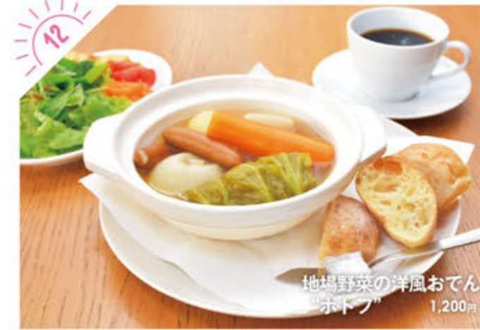
地場野菜の洋風おでん “ポトフ” 1,200円

☎028-611-3464 宇都宮市東宿郷2-4-1 ホテルマイステイズ宇都宮2F ①AM11:30~PM2:00(L.O.) ②日曜、祝日(12/29~1/6) ③6台