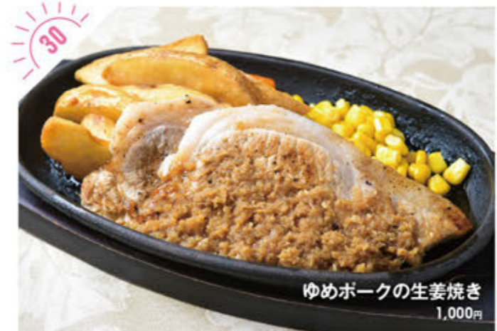
30 ゆめポークの生姜焼き 1,000円