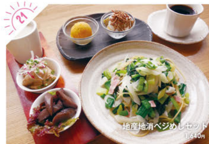
地産地消ベジめしセット 1,640円

☎028-665-8800 宇都宮市新里町丙254 道の駅うつのみやろまんちっく村内 ①AM10:00～PM9:00(L.O./PM8:30) (食事提供はAM11:00～) ②第2火曜 ③1000台