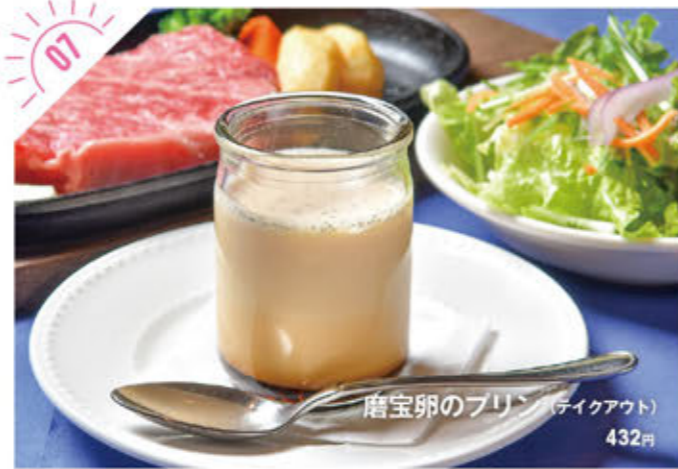
磨宝卵のプリン(テイクアウト) 432円

☎028-680-4180 宇都宮市松田新田町1111-4 ①AM11:30~PM4:00 ②水曜、1/1 ③10台 soba-minorian.jp