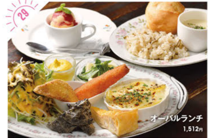
29 オーバルランチ 1,512円