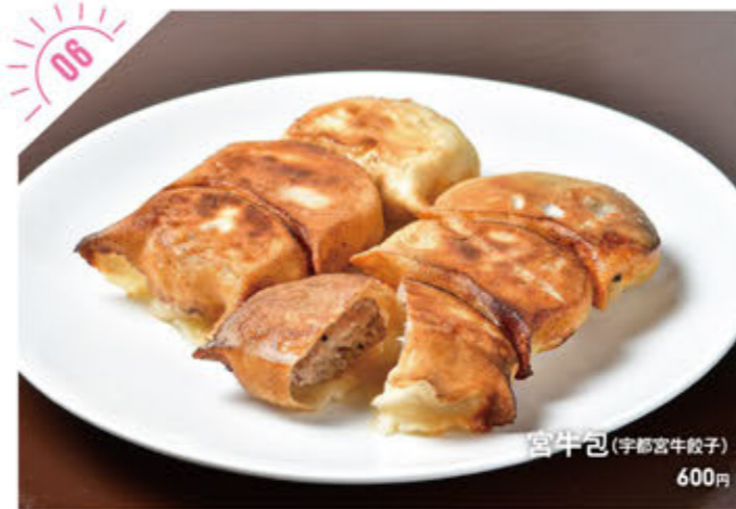
宮牛包(宇都宮餃子) 600円

☎028-678-2525 宇都宮市堀田4-2-18 ①AM11:00~PM2:00(L.O./PM1:30)、 PM5:00~深夜0:00 (金・土曜、祝前日/AM2:00) ②日曜(翌日祝日の場合は営業) ④有り