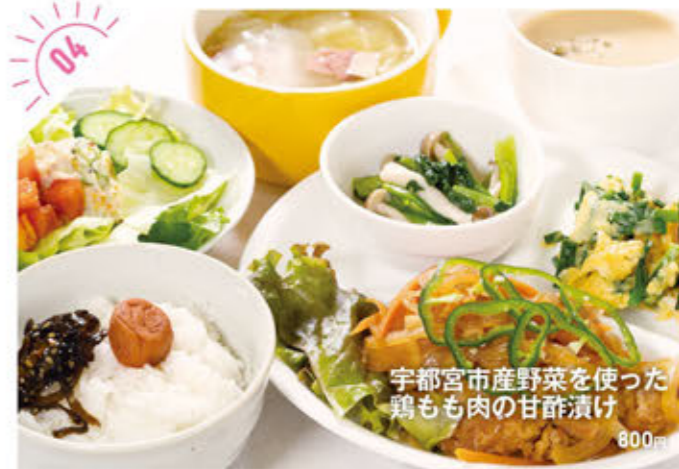
宇都宮市産野菜を使った 鶏もも肉の甘酢漬け 800円

☎028-678-9935 宇都宮市今泉3-13-1/1/1111 ①AM11:30~PM6:30 ②火曜、1/1~1/3 ③6台 http://www.jugemugyouza.com