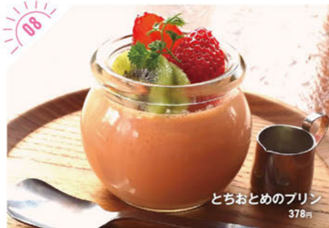
とちおとめのプリン 378円

☎028-638-0409 宇都宮市宮園町8-9 ①AM11:30~PM2:30、PM6:00~PM10:00 ②月曜、日曜の夜 ③5台