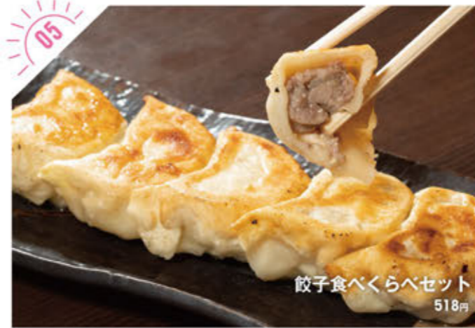
餃子食べくらべセット 518円

☎028-636-8701 宇都宮市中央5-9-2 ①PM5:30~PM9:00 土・日曜、祝日/正午 ~PM1:30(L.O.)、PM5:30~PM9:00(L.O.) ②月曜 ③10台 www.zonjyasu.com