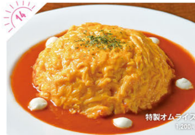
特製オムライス 1,200円

☎028-649-0607 宇都宮市上町795-4 ①カフェ AM10:00~PM5:00(L.O.) ②年末年始は変動あり ※不定休 12月17日~26日はカフェ休み ③6台