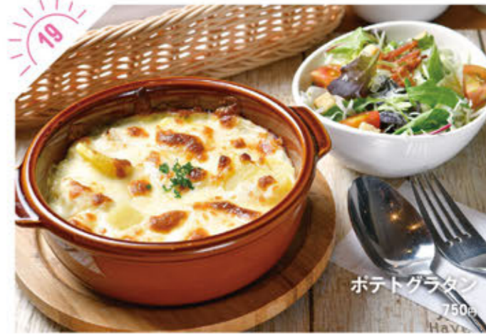
ポテトグラタン 750円

☎028-648-9831 宇都宮市坂上町1085-2 ①AM11:30～PM3:00(L.O./PM2:00) PM6:00～PM10:00(L.O./PM8:30) ②水曜、火曜の夜、12/31～1/1、臨時休業あり ③25台 ameblo.jp/sante831yasai