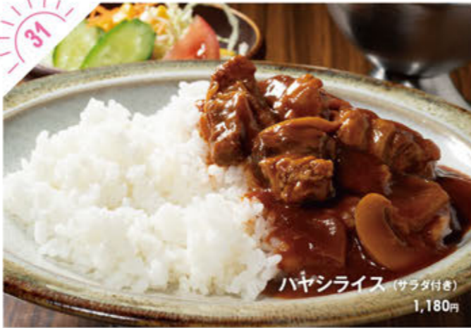
31 ハヤシライス (サラダ付き) 1,180円