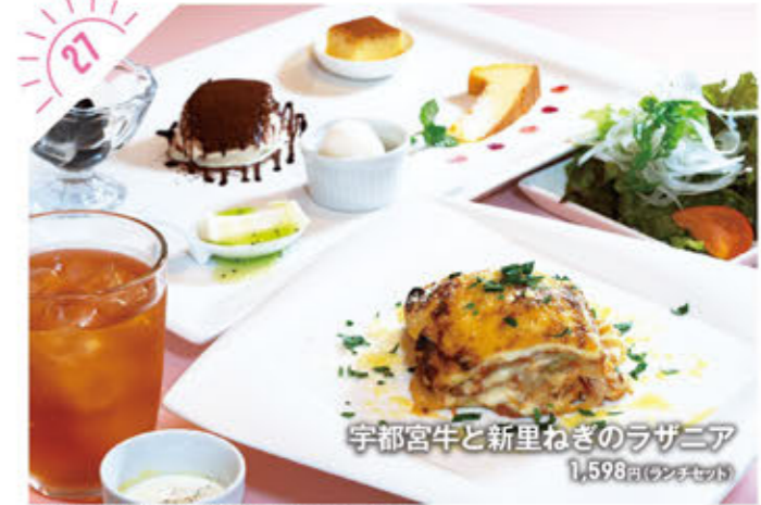
27 宇都宮牛と新里ねぎのラザニア 1,598円(ランチセット)