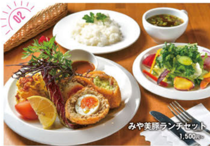
みや美豚ランチセット 1,500円~

☎028-625-4455 宇都宮市山本3-14-7 ①AM11:30~PM9:00(月曜)~PM6:00、 水~金曜/PM7:00 ②火曜、第1・3・5水曜、12/31~1/2 ④7台