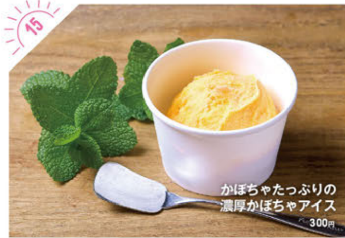
かぼちゃたっぷりの 濃厚かぼちゃアイス 300円

☎028-666-8785 宇都宮市江野町2-11 宮カフェ2F ①AM11:00~PM11:00 ※無休(1/1は休み) 隣近隣コイン利用