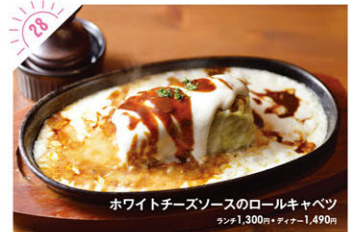
28 ホワイトチーズソースのロールキャベツ ランチ1,300円・ディナー1,490円