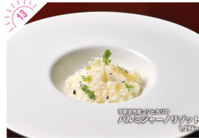
宇都宮市産コシヒカリの ハルミジャーノリゾット 1,296円

☎028-666-0072 宇都宮市上小倉町2571-1 Naturalworksvillage内 ①AM11:00~PM3:00 ※月曜 ②20台 https://www.facebook.com/parfaiteria