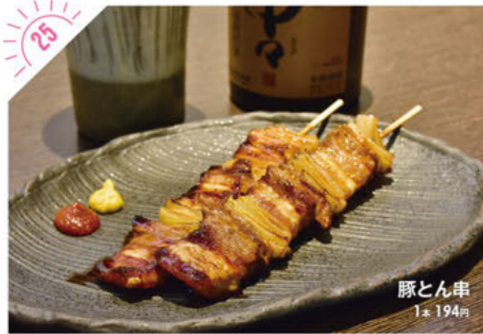
豚とん串 1本 194円