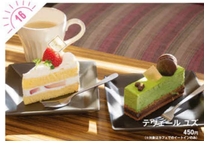
テヴェール ユズ 450円 (※別巻はカフェでのイートインのみ)

☎028-678-4664 宇都宮市上戸町23-8 (©2019年1月11日、宇都宮市松原3-6-28へ移転) ①AM11:00~PM7:00 ※無休 ②10台