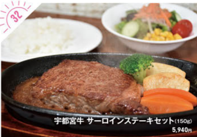
32 宇都宮牛 サーロインステーキセット (150g) 5,940円