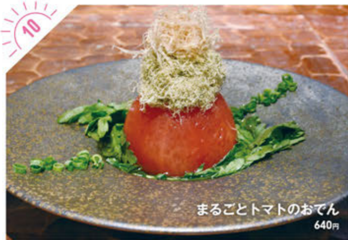
まるごとトマトのおでん 640円

☎028-623-4455 宇都宮市戸祭元町4-5 ①AM11:00~PM3:00、PM5:00~PM9:00 ※スープがなくなり次第終了 ※月・第3火曜(祝日の場合は営業) ※12月30日~1月3日は休み ④有り