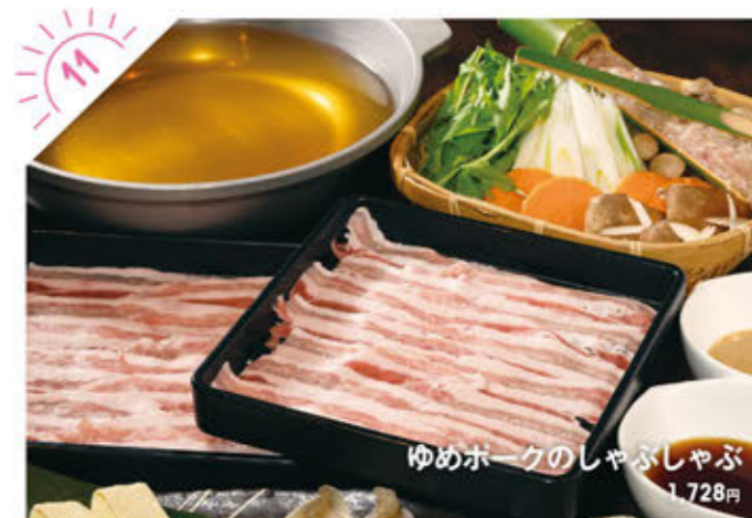
ゆめポークのしゃぶしゃぶ 1,728円

☎028-601-8101 宇都宮市元今泉5-4-6 マロニエエコーハイブ101 ①AM11:30~PM2:30(L.O./PM1:30) PM6:00~PM11:00(L.O./PM9:30) ※木曜(12/31~1/3は休み) ②8台