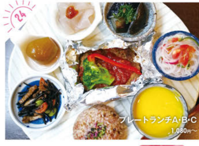
プレートランチA・B・C 1,080円～

☎028-678-9588 宇都宮市川向町1-23 JR東日本ホテルアール・メッセ宇都宮3F ①AM6:30～PM9:00 ②無休 ③提携駐車場あり http://pscoop.jp/lapis/index.html