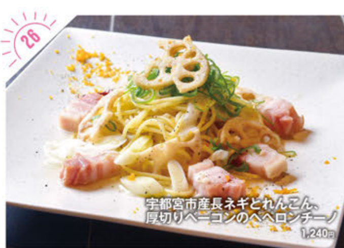
宇都宮市産長ネギとれんこん、 厚切りベーコンのへへろんちーノ 1,240円

☎028-667-2600 宇都宮市ゆいの杜5-1-23 ①AM11:30～PM9:00(L.O./PM8:00) ②木曜、12/27～1/4 ③15台