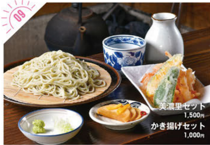
美濃里セット 1,500円 かき揚げセット 1,000円