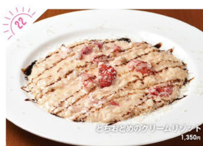
どちおとめのクリームリゾット 1,350円

☎028-615-7474 宇都宮市清原台4-20-30 ①AM11:30～PM5:00 ②日・月曜 ③10台