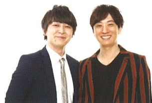
ベリーズ (吉本興業)